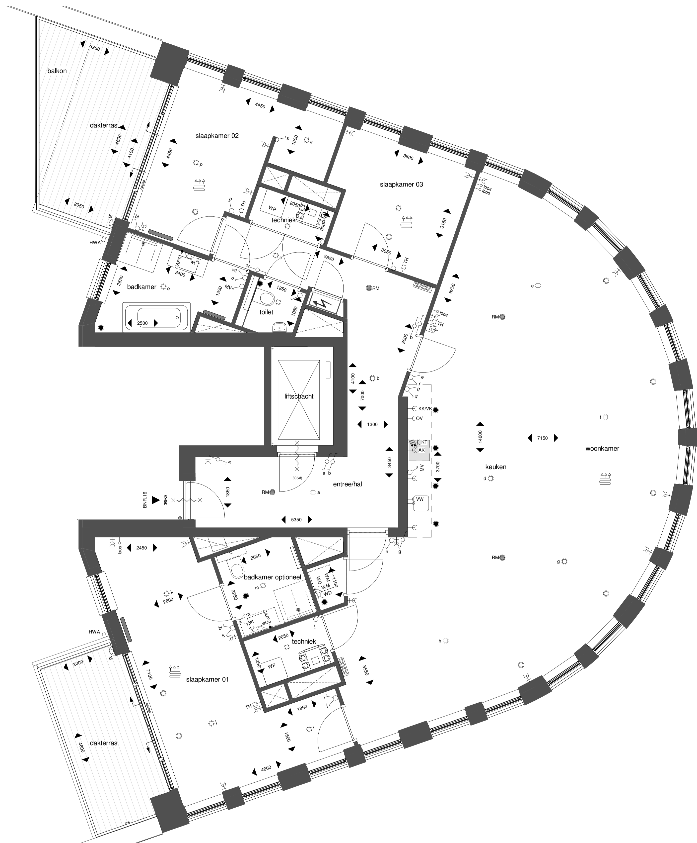
BNR 16 - vierde verdieping