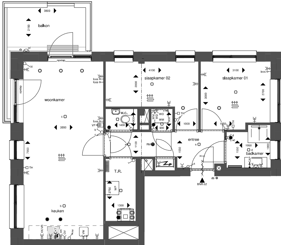
BNR 60 - vierde verdieping